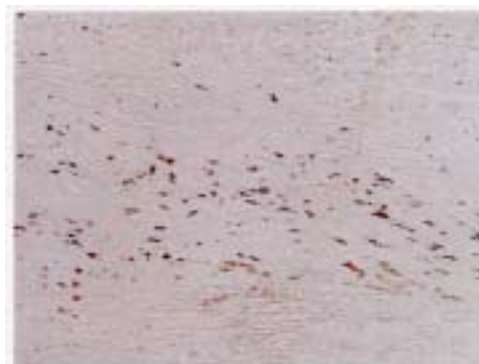
粥状動脈硬化 初期病変 Kume, S. et al, American Journal of Pathology , Vol.147, 654-667, 1995